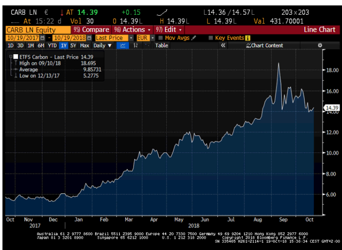
ETFS Carbon Price Chart